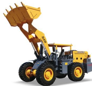
06 ZL935矿用井下轮式装载机