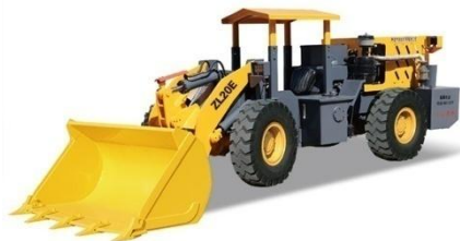
01 ZL20E矿用井下轮式装载机