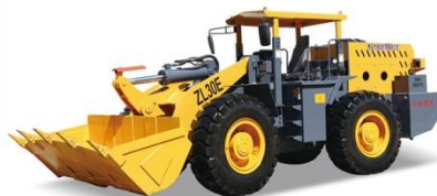
02 ZL30E矿用井下轮式装载机