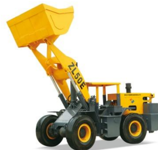
03 ZL50E矿用井下轮式装载机