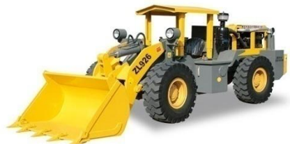
04 ZL926矿用井下轮式装载机