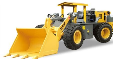
05 ZL928矿用井下轮式装载机